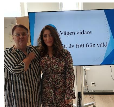
Bild från utbildningsdag som samordnades med Örebro's Kristna Råd

Styrelsen satsade på att stärka föreningens sociala medier genom att anlita byråen We dig it för att publicera inlägg i sociala medier. Därmed når föreningen bättre ut till både potentiella stödsökande, till kommuner som vill placera i det skyddade boendet samt sprider kunskap om mäns våld mot kvinnor och om kvinnors och barns rätt till ett liv fritt från våld.