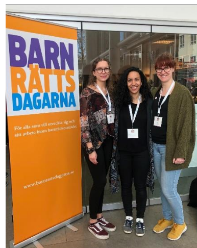
Medarbetare på samverkanskonferensen Barnrättsdagarna i Karlstad

Som ett led i det systematiska kvalitetsarbetet hanteras förbättringsförslag, avvikelser, synpunkter och klagomål kontinuerligt. Beroende på omfattning och sort hanteras den med berörda parter och tas med i verksamhetens generella förbättringsarbete. Utmärkande för i år var ett större antal inrapporteringar vilket tyder på att medarbetare tar sitt ansvar och rapporterar in det som behöver bli bättre, vilket är till stor hjälp. De flesta inrapporteringarna handlar om avvikelser från beslutade rutiner och ingen avvikelse har föranlett ytterligare anmälningar hos såsom Arbetsmiljöverket eller liknande.